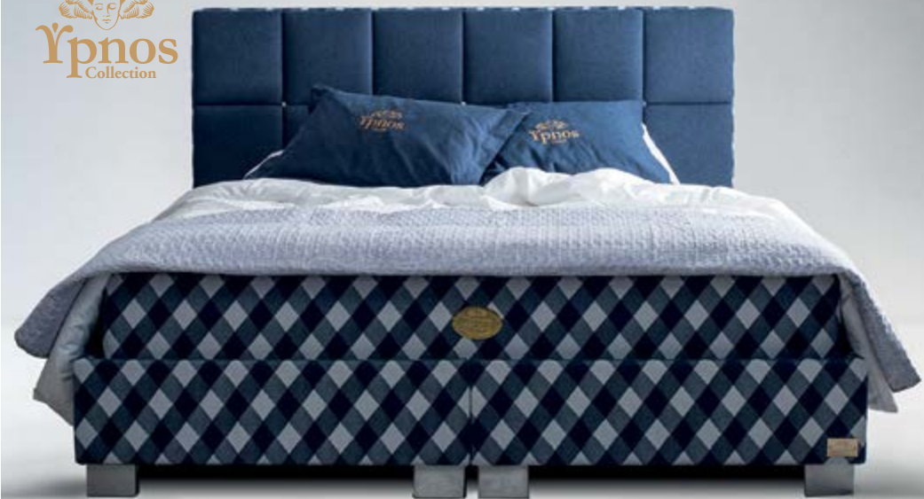
Βάση Sonno Κεφαλαριά Φαίδρα Yrnos Collection