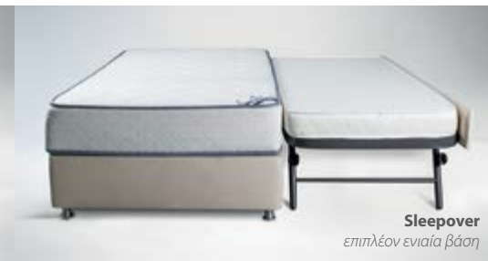
Sleepover επιπλέον ενιαία βάση