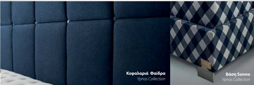
Κεφαλαριά Φαίδρα Yrnos Collection