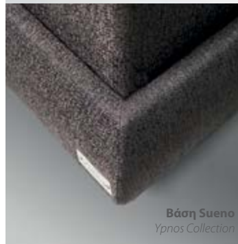
Βάση Sueno Υπνος Collection