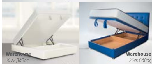
Warehouse 20 εκ βάθος