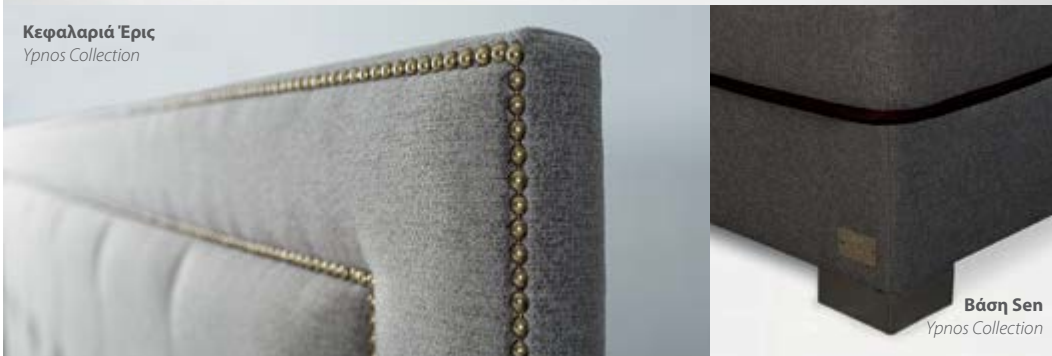
Βάση Sen Yrnos Collection