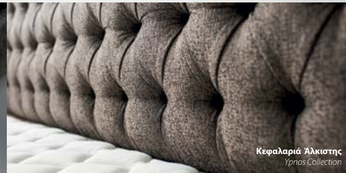
Κεφαλαριά Άλκιστης Υπνος Collection