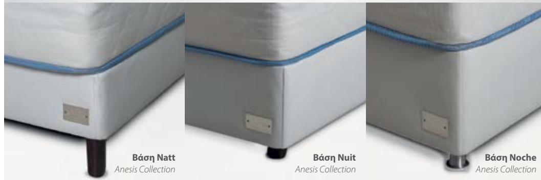
Βάση Natt Anesis Collection