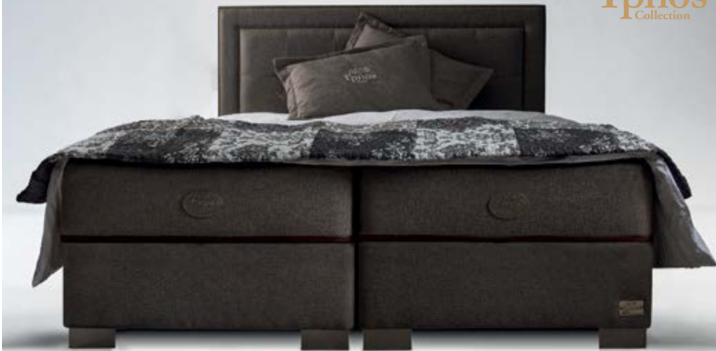
Βάση Sen Yrnos Collection