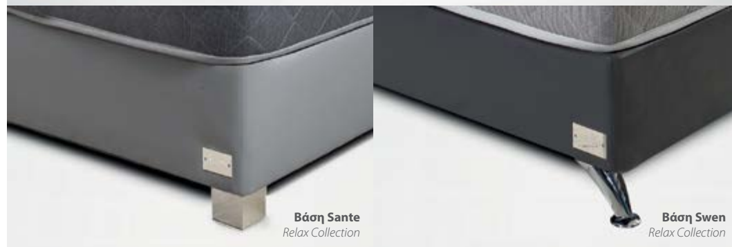
Βάση Sante Relax Collection